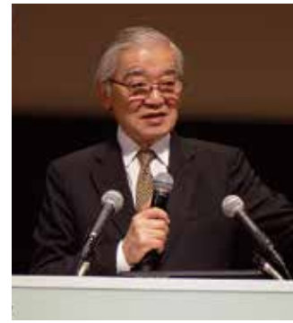
徳川宗家第18代当主