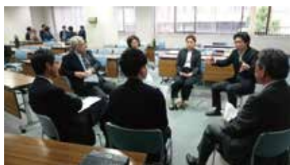
グループディスカッションの様子