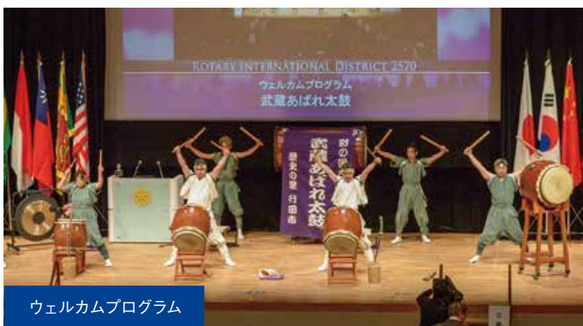
ウェルカムプログラム