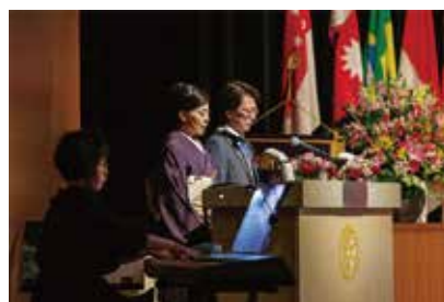
ウェルカムプログラム：武蔵あばれ太鼓