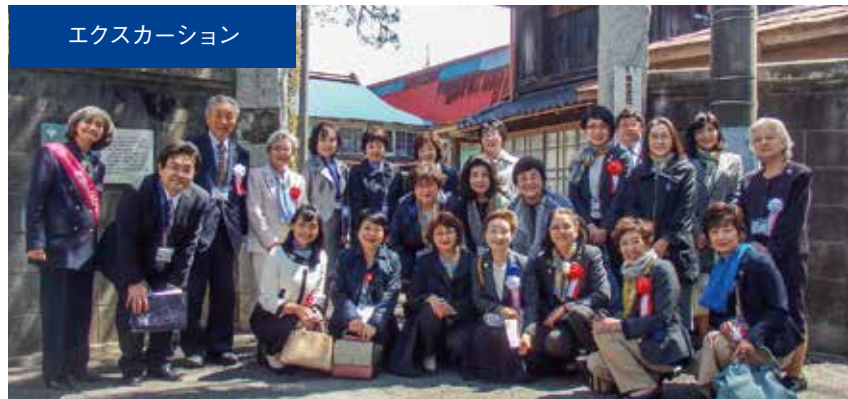
エキスカッション