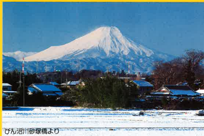
びん沼川砂塚橋より